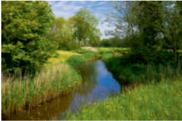
La renaturation d'un ruisseau restaure l'équilibre écologique.

Le parc de la Pétrusse figure parmi les endroits les plus beaux et intéressants de la ville à bien des égards, et il va le devenir encore plus quand le grand projet de renaturation de la vallée sera réalisé.